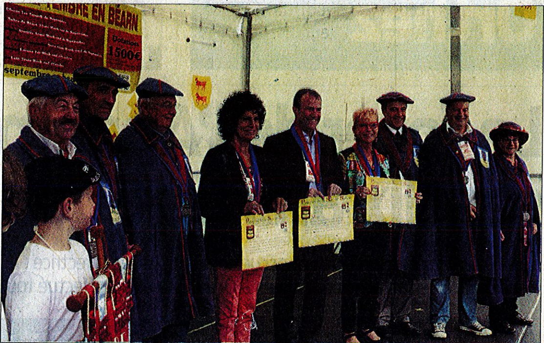
Officiels et personnalités à l'heure des intronisations.