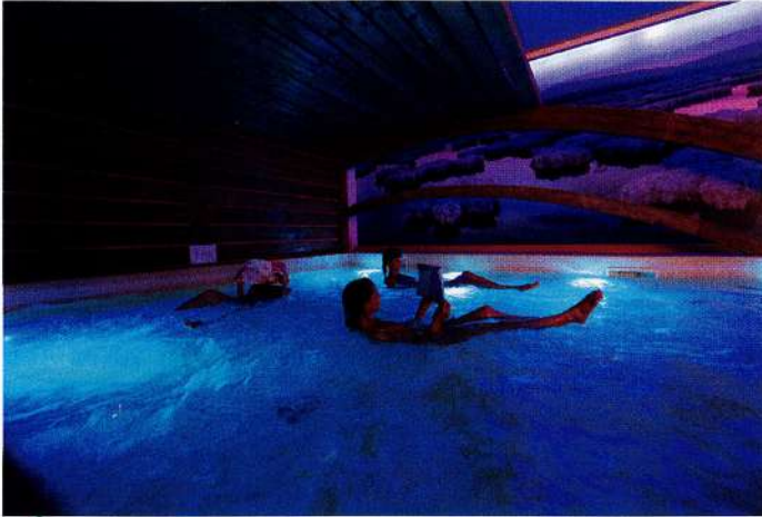
Lagon Mer Morte.

Les Thermes de Salies de Béarn ont été remis en état et embellis suite au déluge de juin dernier, la crue du Saleys ayant inondé la ville.