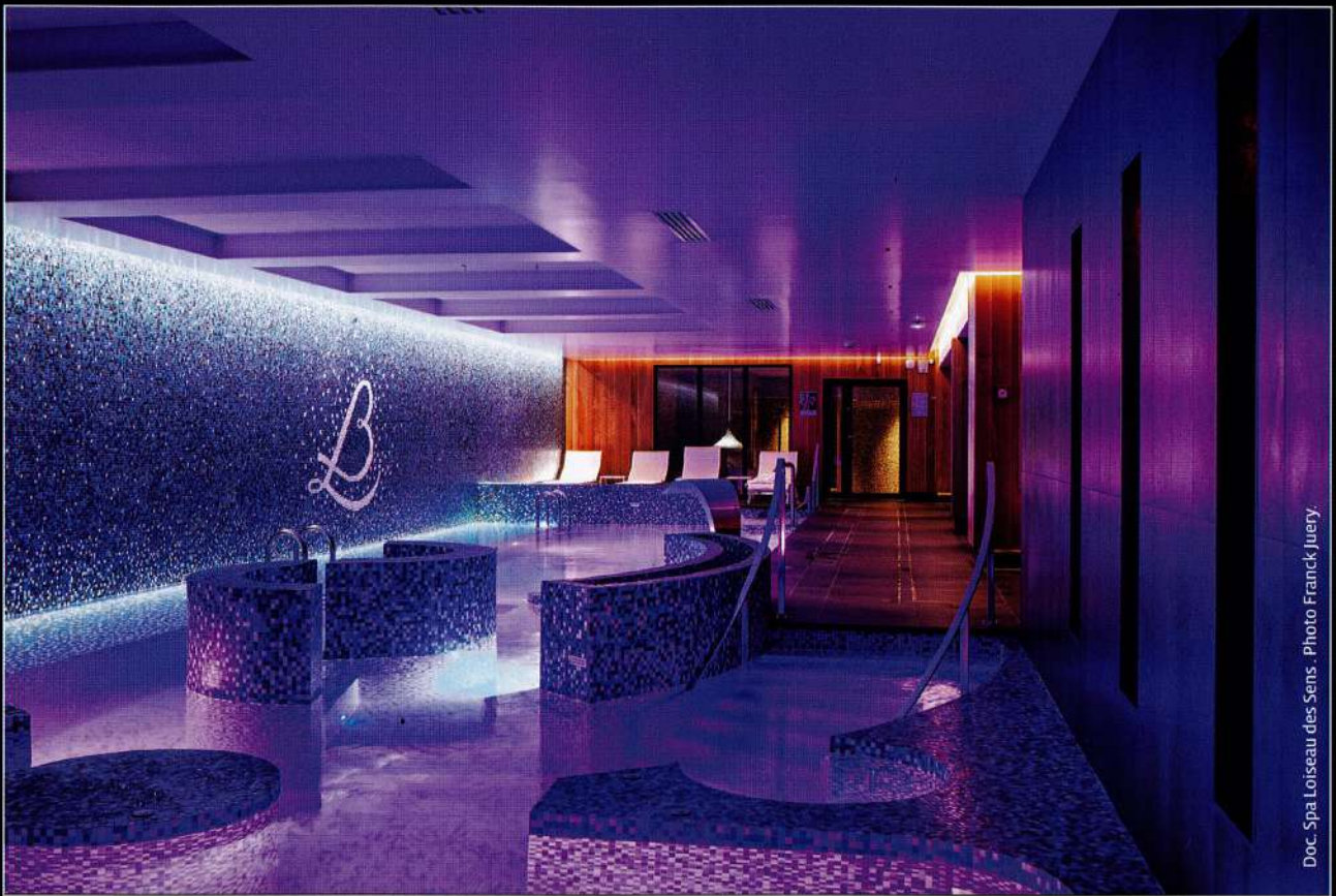
Doc. Spa Loiseau des Sens - Photo Franck Juery.

LE MAGAZINE DES DÉCIDEURS spa | beauté | bien-être | santé